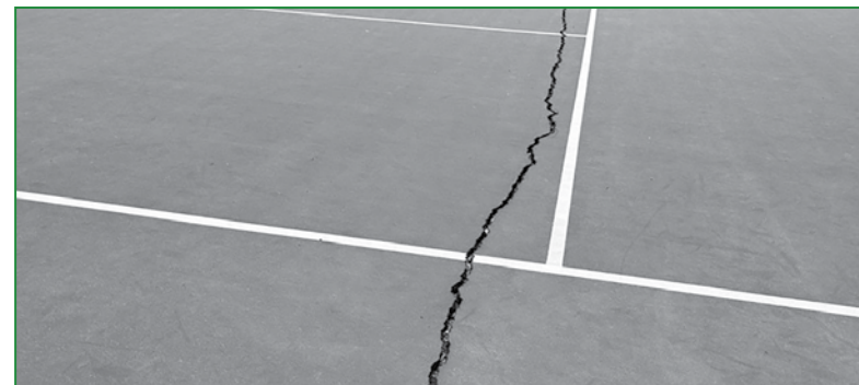
(Izquierda): Se repararán las canchas de tenis de OMS y HHS.