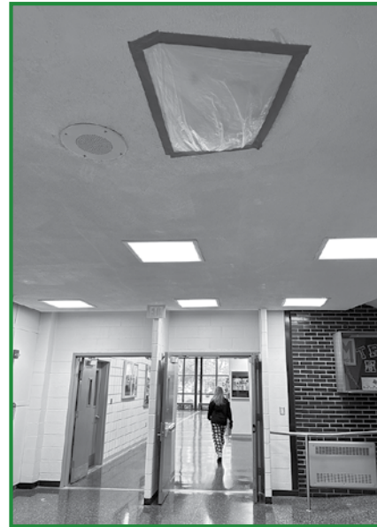
Water pools on the roofs of each school, as pictured below, resulting in numerous leaks throughout the buildings (left).