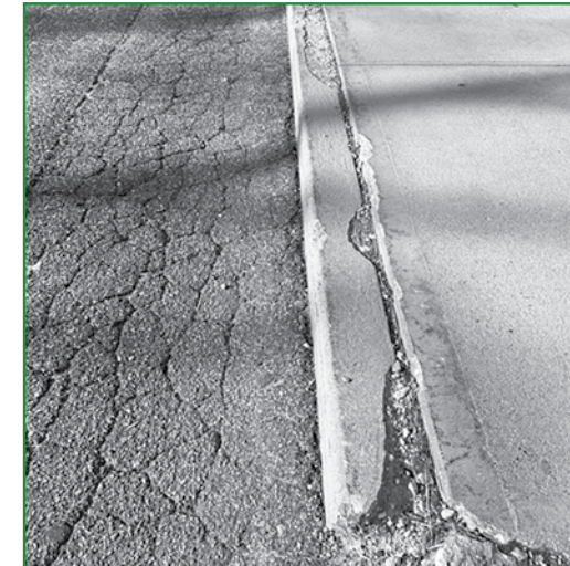
(Above): Infrastructure repairs to curbing, sidewalks and asphalt will be completed.