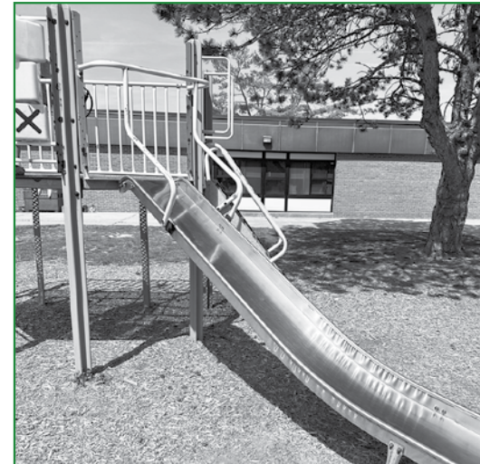
(Above): Playground equipment at TJL and WDPS would be replaced, in addition to safety resurfacing.