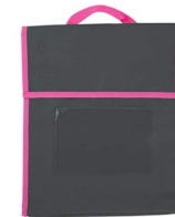
Bolsa de livros