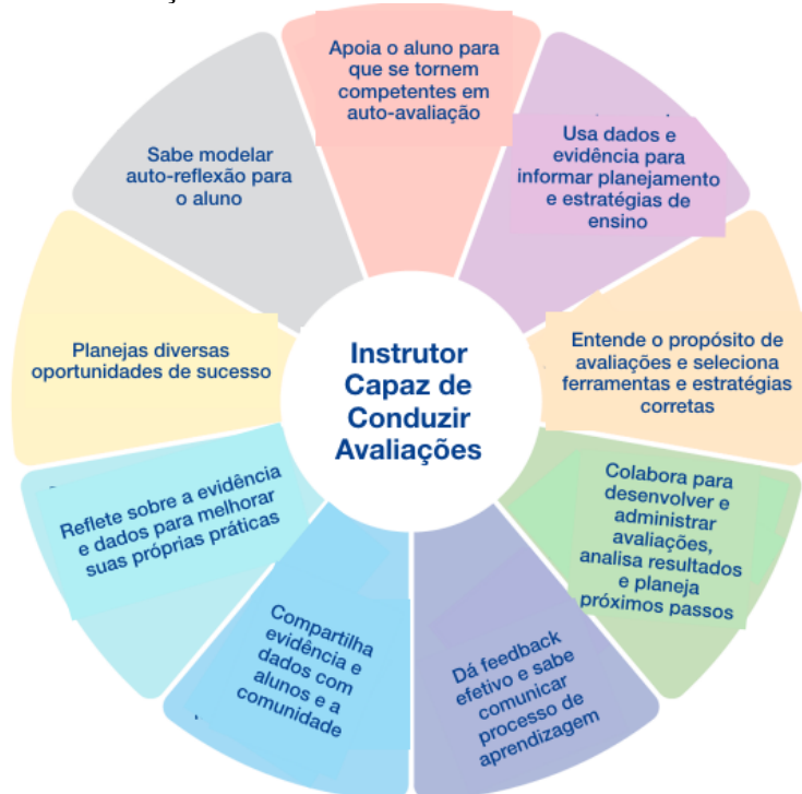
Imagem do IB PYP From Principles into Practice: Learning and Teaching Assessment

Avaliação é o processo de monitorar, documentar, medir e compartilhar o aprendizado usando diversas ferramentas e estratégias. A comunidade de aprendizes da Woodrow Wilson Elementary School colabora e reflete continuamente para desenvolver nossas habilidades de implementar as ferramentas e estratégias de avaliação de forma cada vez mais efetiva.