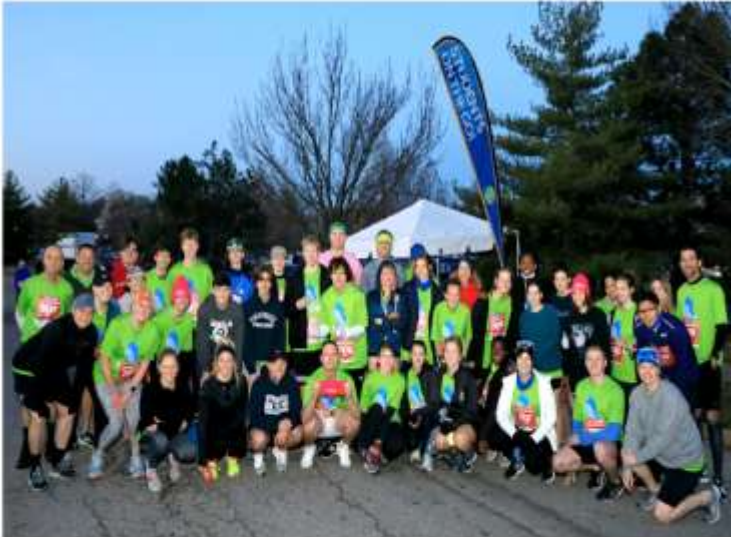
2022 ½ Marathon Group