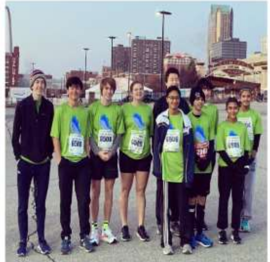
2022 10K Group