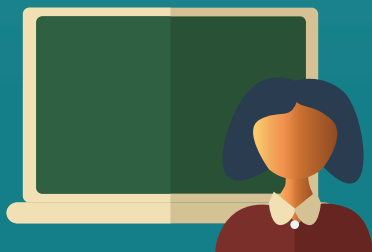
MAESTROS CERTIFICADOS DE AUSD

Los alumnos participan completamente en el aprendizaje a distancia, con maestros de AUSD.