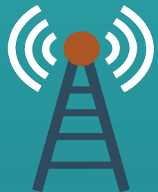
APRENDIZAJE A DISTANCIA